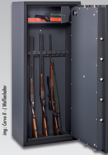
img.: Cervo II - (Waffenhalter)

Nur relevant für Deutschland · Just relevant in Germany · N`est que valide pour l'Allemagne: