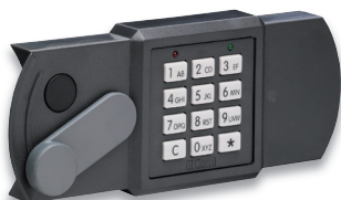
img.: Ekom 7205