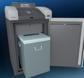
Cash Collect aperto con box di raccolta