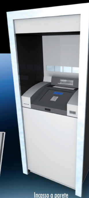
Incasso a parete