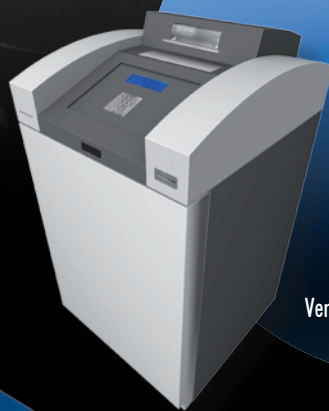
Versione Stand alone