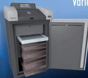
Cash Collect aperto con sacco di raccolta